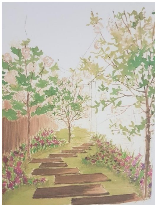
Trabajo en acuarela de la alumna de Anteproyecto I 2019 Julieta Riverti. Croquis en el que la alumna muestra su diseño del jardín del retiro lateral.

En la década de los ochenta, la Escuela de Jardinería amplió sus cursos ofreciendo una segunda opción de enseñanza: el diseño de la jardinería.