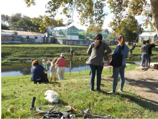
Alumnos realizando un relevamiento altimétrico en el entorno del arroyo Miguelete.