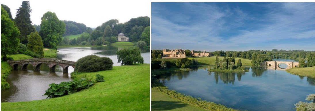
Jardines paisajistas de Stourhead y de Blenheim, lo irregular, obras de Lancelot Capability Brown.

El racionalista Nicolás Boileau 11 pensaba que el arte debía recoger de la naturaleza lo que tiene de más noble y transformarla de lo que es a cómo debería ser .