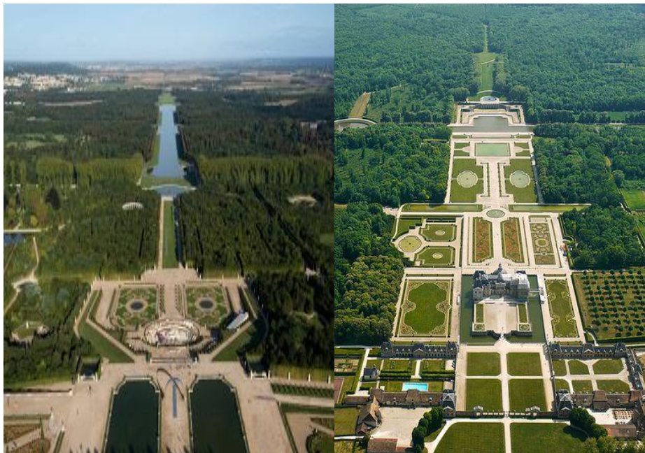
La gran perspectiva de Versailles y de Vaux le Vicomte, lo regular, obras de André le Nôtre.

La concepción del espacio en el jardín francés, ordenado según la geometría y la visualidad, materializa en sus perspectivas construidas una manera de entender el poder y su ejercicio. Los jardines de Versailles son el mejor y más conocido ejemplo de la identificación entre espacio y poder. Posteriormente, esta concepción tendrá consecuencias urbanas en la reordenación de París por el Barón de Haussmann, bajo las órdenes de Napoleón III, a mediados del siglo XIX.