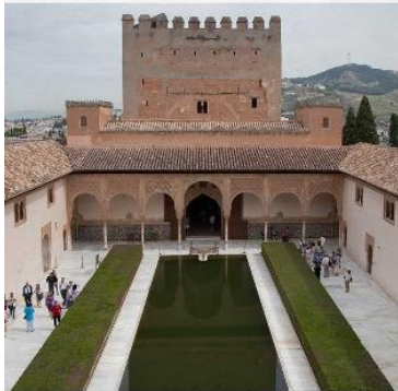
Patio de Comares (Alhambra, siglo XIV), setos de mirto. 3

En los jardines hispanoislámicos se utilizó boj, mirto, laurel y ciprés para crear setos con formas geométricas que organizaban al jardín en espacios cerrados, íntimos y a la escala del hombre, donde destacaban flores, frutales y otros vegetales. El discurrir del agua por pequeños canales o acequias, contribuían al disfrute de estos exquisitos jardines sensoriales.