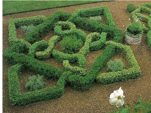
Knot garden. 6

La composición barroca atenuó la rigidez esquemática del siglo anterior e incorporó nuevos efectos escenográficos más fantasiosos y más naturales. El jardín formal comenzó a compenetrarse con el paisaje circundante.