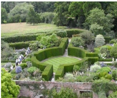
Jardín de Sissinghurst (Kent, Inglaterra), 1940. 7

Desde finales del siglo xx, la poda ornamental ha experimentado un auge, recuperando su importancia en la planificación de parques y jardines. La topiaria ha sido redescubierta y utilizada con criterios contemporáneos, modelando formas geométricas y de fantasía y usándola para crear diseños abstractos con el uso de una o más especies dispuestas en grandes masas ordenadas. Se ha enriquecido con nuevas técnicas, nuevos materiales y nuevas expresiones que ofrecen resultados de gran efecto decorativo.