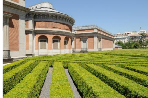
Jardines de boj, Museo del Prado (Madrid, España), 2008. 2