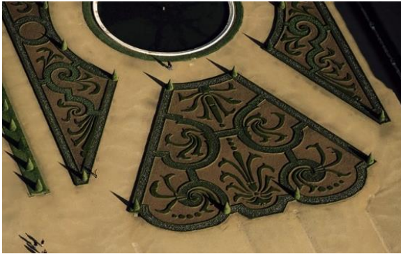
André Le Nôtre, parterre du Midi (Versailles, Francia), siglo XVII. 5

culminante con André Le Nôtre (París, 1613-1700), diseñador de los jardines de Versailles para el rey Luis XIV desde 1645 hasta su muerte.