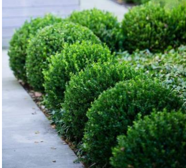
Poda ornamental de boj. 1

La poda ornamental consiste en crear y mantener un árbol o un arbusto con una forma determinada y adecuada a las condicionantes del espacio urbano. Quizás recortando de manera regular y profesional aquellas brotaciones que sobrepasen los perfiles establecidos para ocupar, fundamentalmente los espacios urbanos.