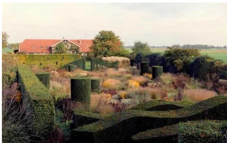
Piet Oudolf, a partir de 1982, crea su jardín-vivero en Hummelo (Holanda): herbáceas anuales y bianuales junto a setos y formas recortadas de hoja perenne. 11

Podemos concluir que el jardín contemporáneo mantiene el estímulo de la fantasía, que es posible gracias al perfeccionamiento e innovación en las herramientas, que atrae a profesionales y aficionados hacia la utilización de la poda en la búsqueda de novedosos efectos ornamentales.