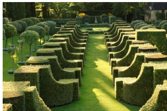
Jardines du-Manoir d'Eyrygnac (Aquitania, Francia), reinaugurado en 2013. 10

Para lograr resultados en una intervención de arte topiario, además de conocer la metodología para obtener un efecto decorativo, se necesita disponer de tiempo, interés y paciencia para